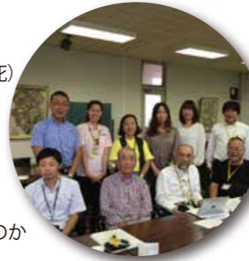
「南河内のつどい」世話人会