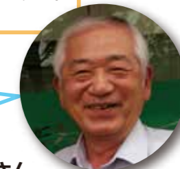
三角さん (高辺台1丁目自主防災会)

「きんきうえび」が手を挙げて支援センターを引き継いだことで官から民に180度変わり、団体間の交流が図れる運営で官の影が見えず、担当者が我々と同じ目線で相談に乗って頂けるのが助かります。また物品の貸し出しも気軽にお願いしていただき、アンプ付ワイヤレスマイクとスピーカーを借りて10月4日の防災訓練を今以上に会場を盛り上げることができるのでは?!と期待しています。