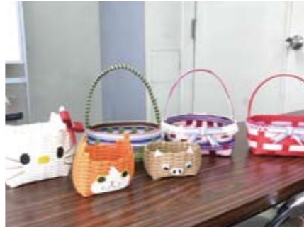
2017年夏休み親子イベント子供たちの作品