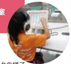
昨年のも忘れチェックの様子

～発足2周年記念講演会決定～ 日時:8月12日(日)13時～ 場所:すばるホール3階会議室 ※相談・測定・体験あり!