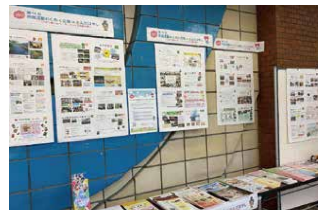
第16回ひろとんの様子