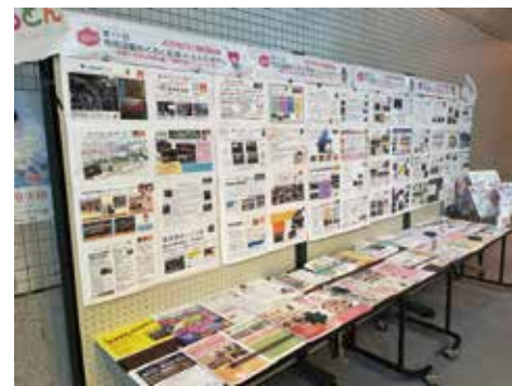
写真は昨年の様子